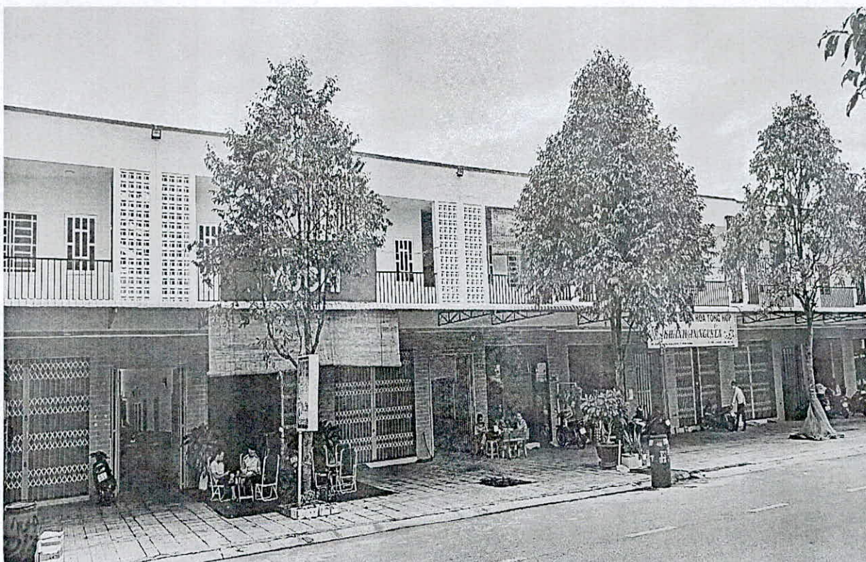
Hình ảnh nhà tại Lô A51/ Bàu Bàng (Bàn giao khách hàng)