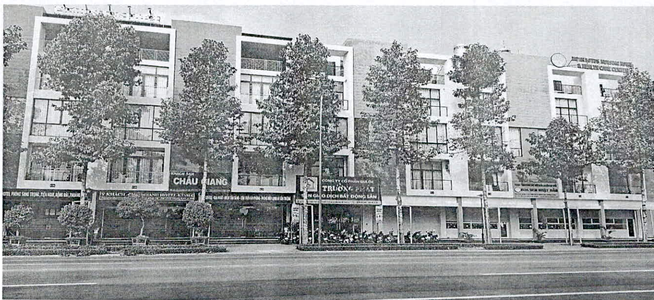
Hình ảnh nhà Dự án GREEN PEARL – TPM.BD (Giáp Đường Lê Lợi)