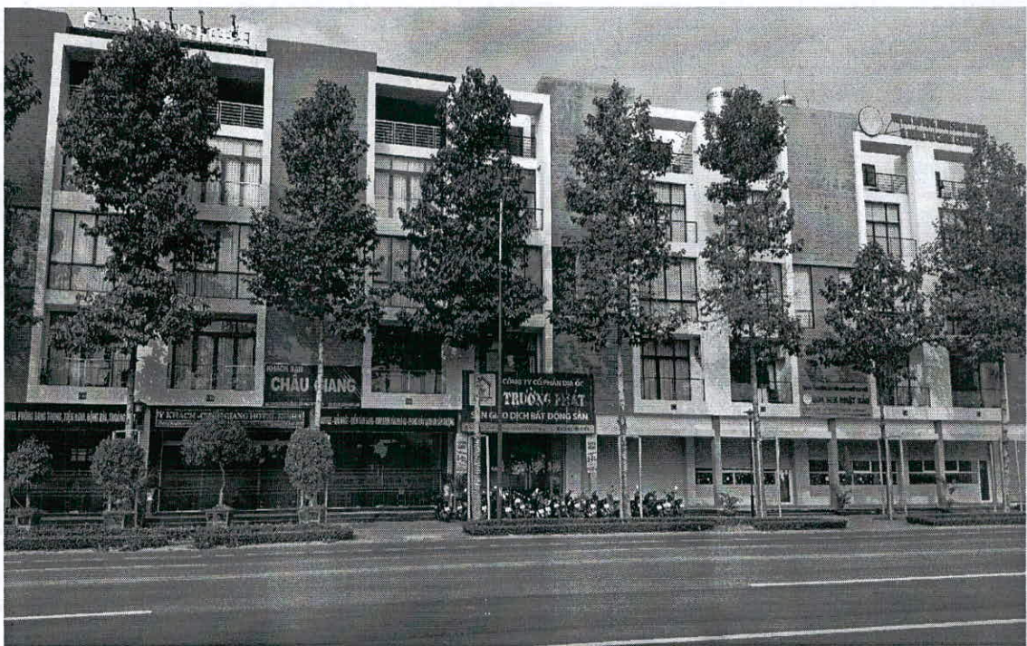
Hình ảnh nhà Dự án GREEN PEARL – TPM.BD (Giáp Đường Lê Lợi)

+ Phương hướng : Trên cơ sở có giấy CN.QSDĐ, đơn vị tiến hành chuẩn bị để hoàn thiện hồ sơ pháp lý để ra giấy chứng nhận cho khách hàng (dự kiến hoàn thành trong năm 2026).