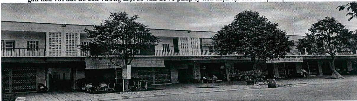
Hình ảnh nhà tại Lô A51/ Bàu Bàng (Bàn giao khách hàng)

- Tình hình pháp lý của dự án Bàu Bàng: Đã ra sổ đất 100% cho khách hàng. Riêng quyền sở hữu nhà gắn liền với đất do còn vướng một số vấn đề về pháp lý nên hiện tại chưa thực hiện.